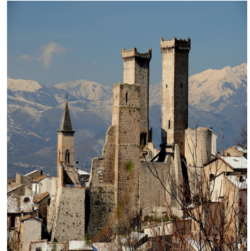
Borgo storico di Pacentro