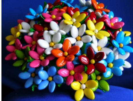
Fiori realizzati con i confetti di Sulmona